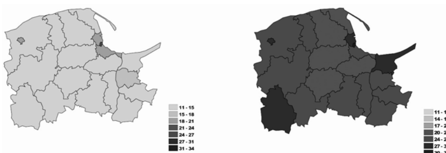
Rysunek 3. Udział osób w wieku 60+/65+ w poszczególnych powiatach województwa pomorskiego odpowiednio w roku 2011 oraz 2035 (w %)

Według prognoz GUS w roku 2035 najwyższy odsetek osób w wieku poprodukcyjnym (60+/65+) zanotują: Sopot – 33%, Słupsk – 29,7%, Gdynia – 27,7%, a także powiaty nowodworski – 27,3% i człuchowski – 27,4%. Oznacza to, że w wymiarze demograficznym, w najtrudniejszej sytuacji będą ośrodki miejskie oraz powiaty, które obecnie charakteryzuje niekorzystna sytuacja ekonomiczna, w tym sytuacja na lokalnym rynku pracy. Należy zatem przyjąć, że o ile w pierwszym przypadku (dużych miast) powodem znaczącego pogorszenia struktury demograficznej lokalnej społeczności jest rosnąca atrakcyjność podmiejskiego stylu życia i odpływ osób młodych z miast do gmin sąsiednich, o tyle w drugim przypadku (powiatów o najwyższej obecnie stopie bezrobocia w regionie) – główny powód stanowi odpływ młodzieży związany z migracją zarobkową.