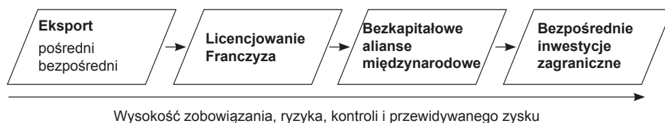
Rys. 1. Podstawowe cechy sposobów wejścia na rynki międzynarodowe

łączenie wiedzy partnerów (Pakulska T., Poniatowska-Jaksch M., 2015, s. 120–122). Umożliwia rozłożenie między nimi ryzyka i zapewnia dobry wizerunek spółki na rynku miejscowym. Wysokie koszty wejścia połączone są z wysokim ryzykiem działalności oraz ewentualnym konfliktem interesów eksportera i partnera. Ostatnią formą inwestycyjną jest spółka córka (spółka w pełni zależna), czyli w całości stanowiąca własność przedsiębiorstwa macierzystego. Zachowanie pełnej kontroli jest zapewnione przez kontrolę centralną. Zapewnia dobry wizerunek na rynku miejscowym i potencjalnie największą opłacalność finansową. Podobnie jak spółka joint venture posiada wysokie koszty wejścia oraz wysokie ryzyko działalności. Wszystkie formy inwestycyjne posiadają skomplikowaną procedurę rejestracyjną.